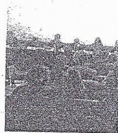
Un'altra immagine del convegno