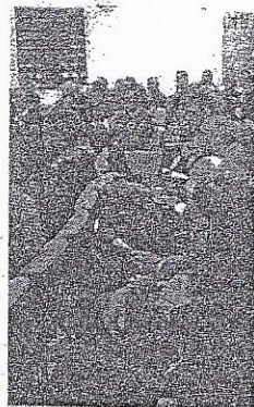
Uno scorcio del pubblico